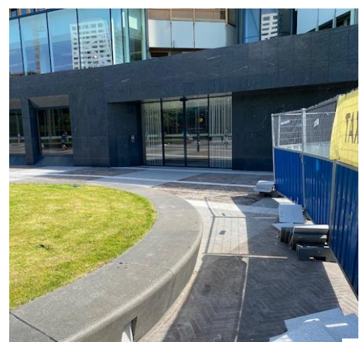
Bel aan bij de 1 e schuifdeur rechts. Na het aanbellen wordt de deur automatisch geopend. U hoeft verder niets in te spreken of te doen.