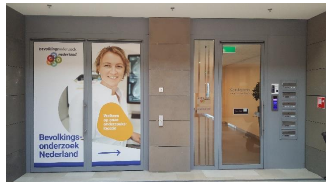
De toegang naar het onderzoekscentrum (de deur rechts op de foto).