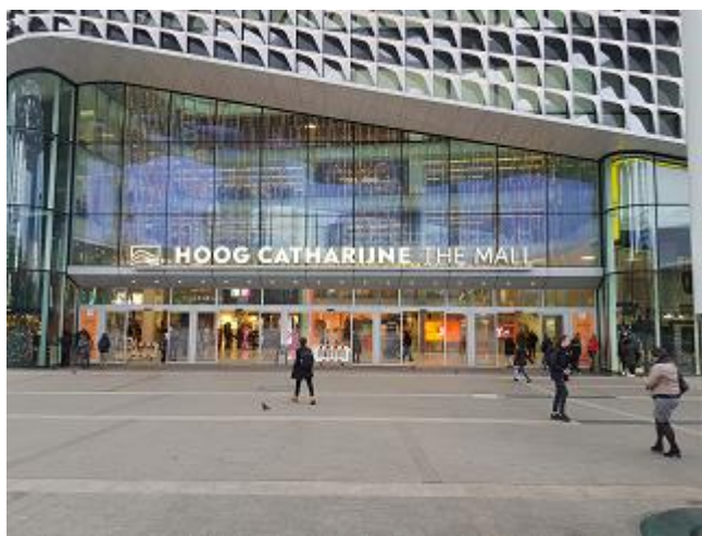
De ingang van Hoog Catharijne.