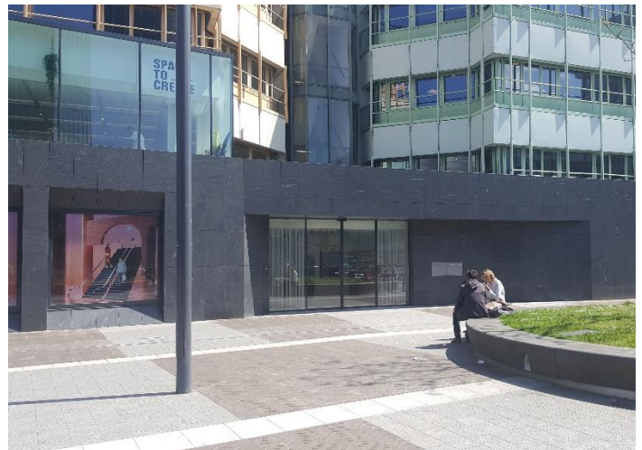
Bel aan bij de 2 e schuifdeur links. Na het aanbellen wordt de deur automatisch geopend. U hoeft verder niets in te spreken of te doen.