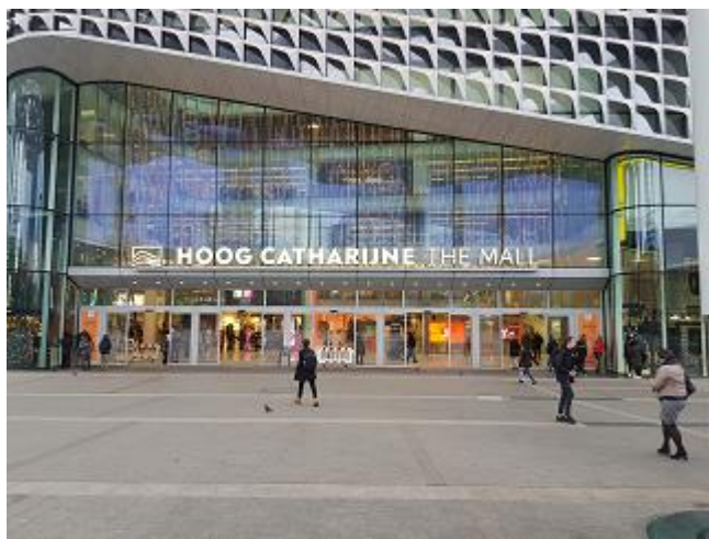
De ingang van Hoog Catharijne.