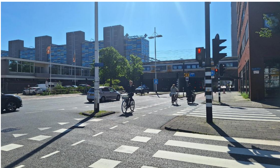
Sla aan het eind van de Bargelaan linksaf en loop onder het viaduct door