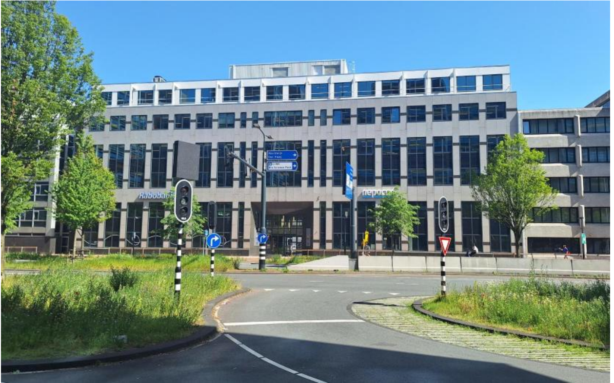
Onderzoekslocatie aan de Schipholweg 9, hoofdingang (gedeeld met Rabobank)