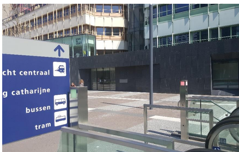
Ga bovenaan naar rechts.