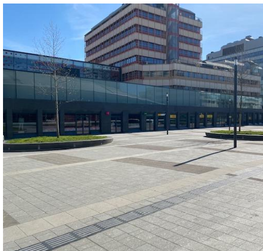
Loop niet naar de ingang van Hoog Catharijne, maar ga naar rechts.