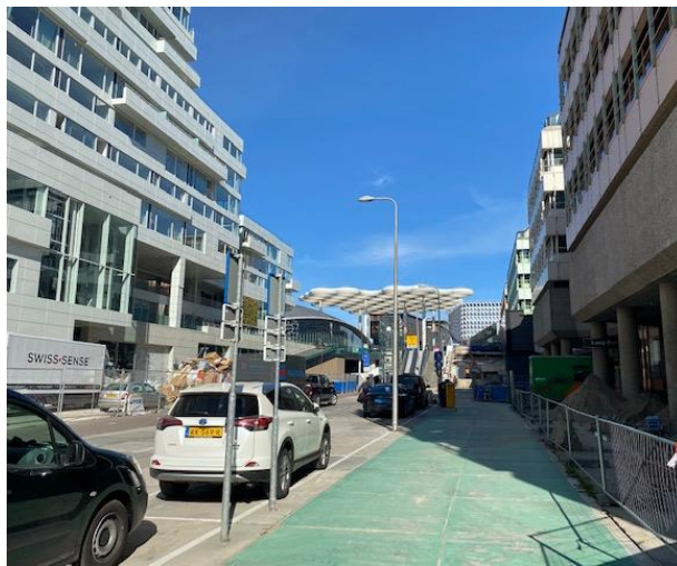
Richting station Utrecht Centraal/Hoog Catharijne.