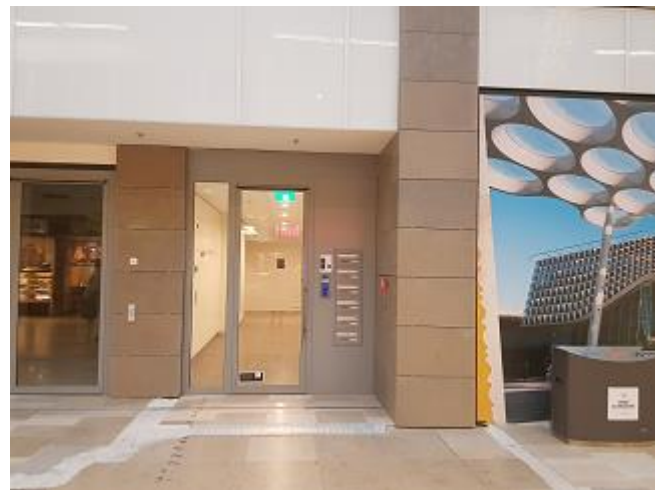
De toegang naar het onderzoekscentrum.