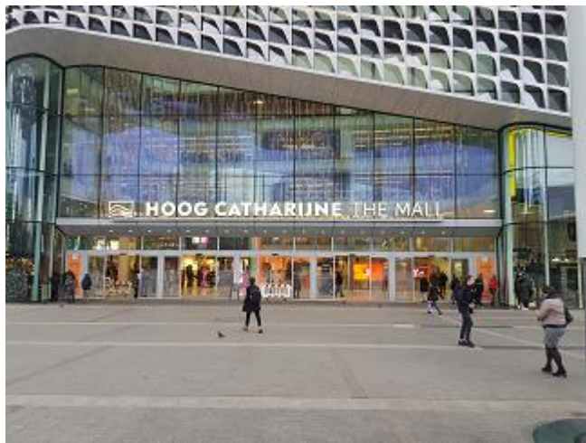
De ingang van Hoog Catharijne.