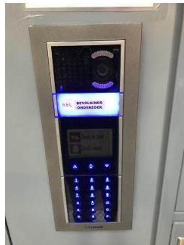
Het belsysteem bij de toegangsdeur: - Toets pijlen omhoog of omlaag om 'Bevolkingsonderzoek' te zoeken - Toets op het bel-teken voor verbinding