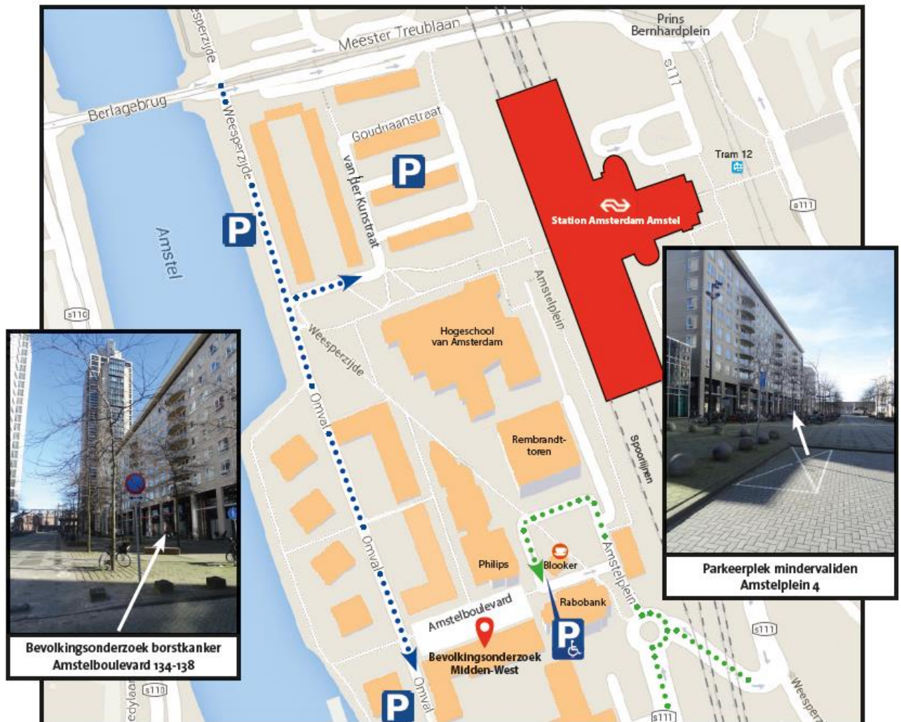
Bevolkingsonderzoek borstkanker Amstelboulevard 134-138

Bent u met de fiets? Er loopt een fietspad langs de blauwe autoroute.