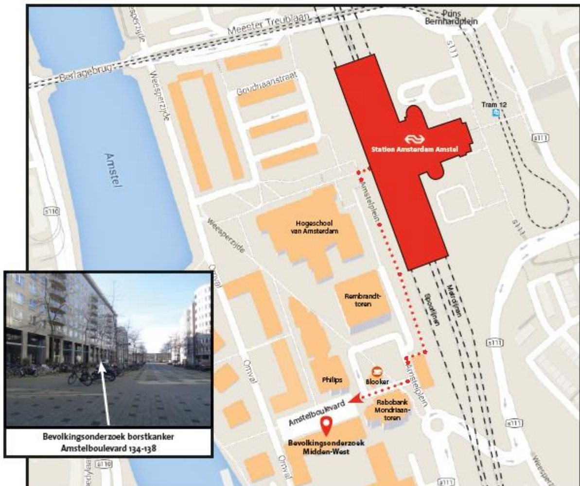
Looproute vanaf station Amsterdam Amstel

Als u het station Amsterdam Amstel alleen gebruikt om doorheen te lopen, vergeet dan niet uw OV-chipkaart mee te nemen. U kunt het beste in- en uitchecken via de GVB-poortjes. Er wordt geen saldo van uw OV-chipkaart afgeschreven.