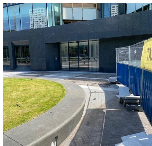
Bel aan bij de 1 e schuifdeur rechts (Kantoren Van Duvenborch, Stationsplein 89, 90, 91, 97 en 109).