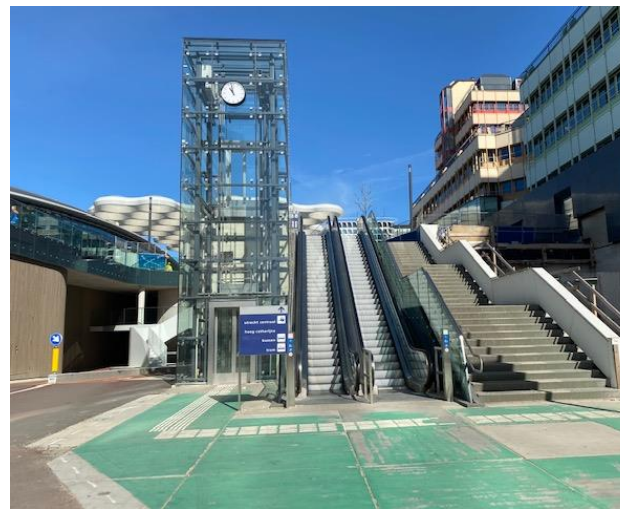
De roltrap of trap naar station Utrecht Centraal/Hoog Catharijne (de lift is momenteel helaas buiten gebruik).