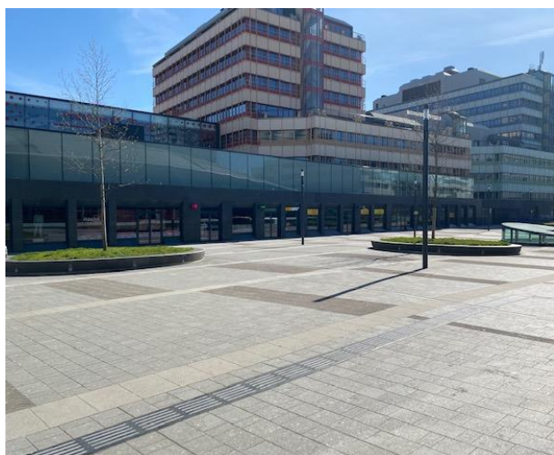
Loop niet naar de ingang van Hoog Catharijne, maar ga naar rechts.