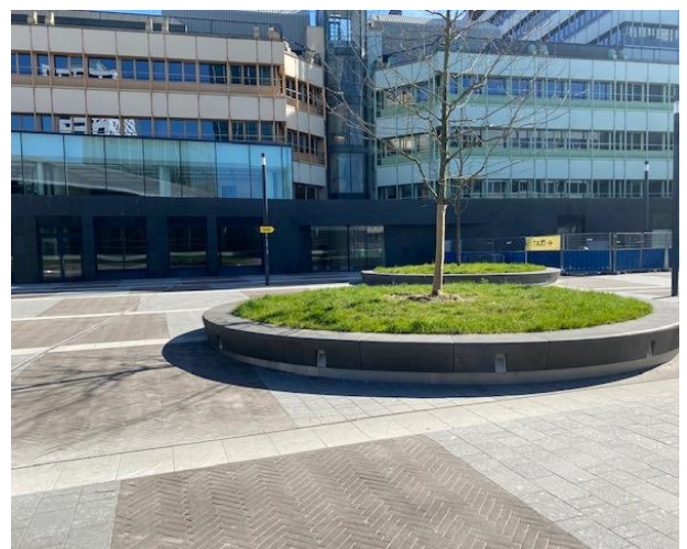
Bel aan bij de 1 e schuifdeur links (Kantoren Van Duvenborch, Stationsplein 89, 90 91, 97 en 109).