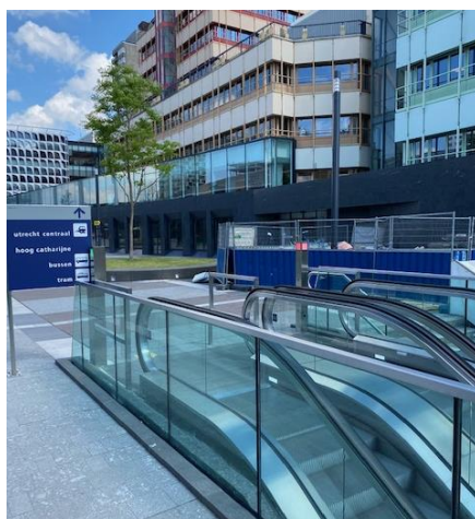
Ga bovenaan de roltrap of trap naar rechts.