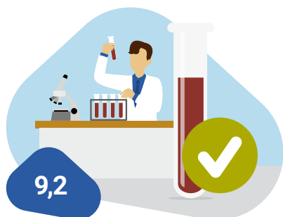
Informatie uitslagbrief: cliënt bij wie geen bloed in de ontlasting is gevonden