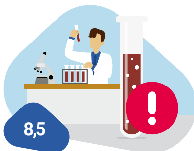
Informatie uitslagbrief: cliënt bij wie bloed in de ontlasting is gevonden