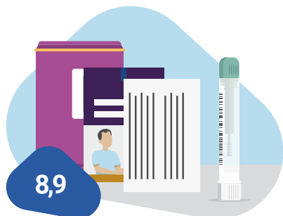
Informatie in de uitnodigingsset