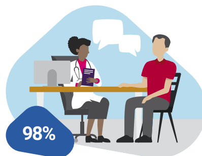
Afspraak gesprek voor vervolgonderzoek gemakkelijk te wijzigen