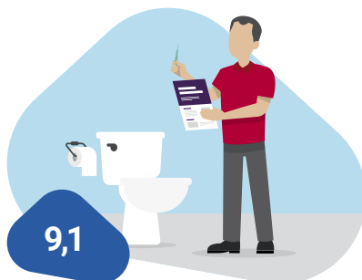
Uitvoeren van de ontlastingstest