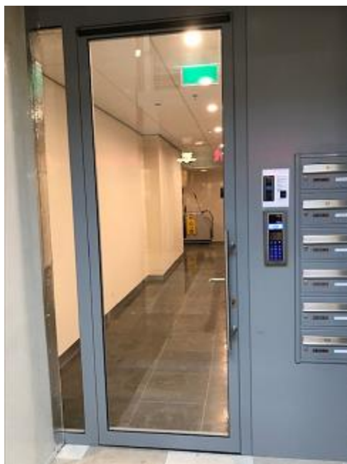
De toegangsdeur naar het onderzoekscentrum.