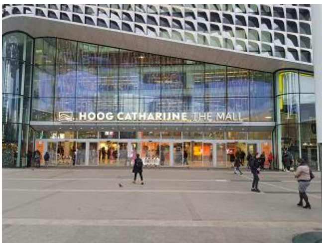
Ga naar de ingang van Hoog Catharijne.