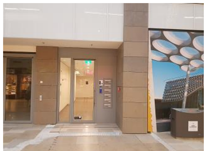
De ingang van het onderzoekscentrum.