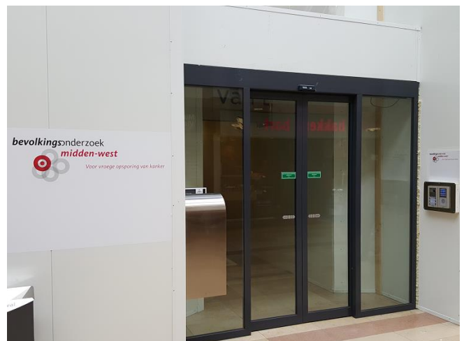
De ingang van het onderzoekscentrum.